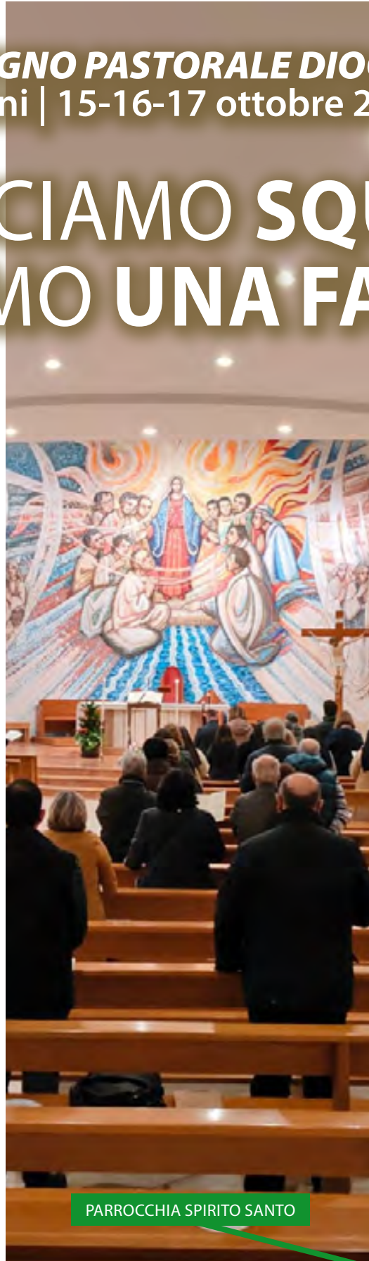
PARROCCHIA SPIRITO SANTO