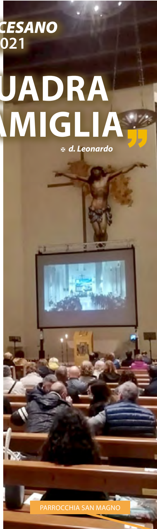
PARROCCHIA SAN MAGNO