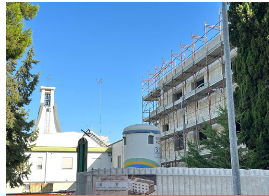
Costruzione del nuovo complesso oratoriale della Parrocchia Cuore Immacolato - Barletta

Le varie somme, come sopra indicate, sono