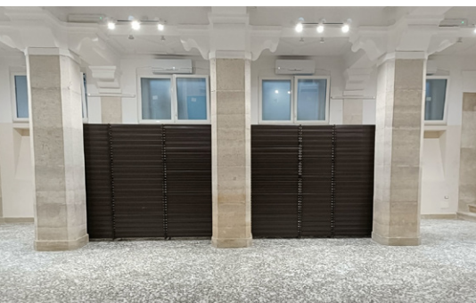
Il locale dove sarà implementato l'emporio della Caritas di Trani

la in particolare l'adeguamento dell'immobile sito in Trani da destinare alle attività della Caritas Diocesana che potrà offrire accoglienza, attenzione e premura a coloro che versano in situazioni di disagio economico; il centro Caritas di Corato, deposito unico delle derrate alimentari e luogo di preparazione e smistamento dei viveri per tutte le Caritas parrocchiali della città; l'allestimento dell'Emporio solidale per le persone e famiglie bisognose oltre che il dormitorio per persone senza fissa dimora, un punto di distribuzione vestiario e viveri ed attività di accoglienza.