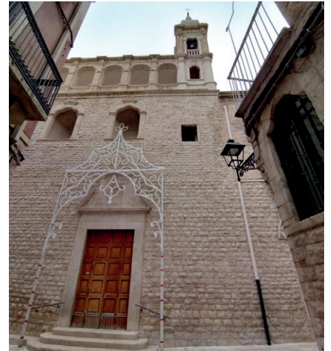
Chiesa di San Benedetto - Corato

state erogate con mandati di pagamento sottoscritti dal responsabile dell'Ente beneficiario, dall'Economo e dall'Ordinario Diocesano, tramite l'Ufficio Amministrativo, presso il quale si conservano le relazioni e le ricevute di versamento relativi ai contributi assegnati ed erogati. I dati definitivi delle somme, prima assegnate e successivamente erogate, sono pubblicati e diffusi tramite i mezzi di comunicazione di cui la diocesi dispone (Bollettino diocesano, periodico 'In Comunione' del mese di giugno e la pagina dedicata su sito diocesano), dandone notizia, ad altri mass media del territorio, tramite l'ufficio diocesano delle comunicazioni sociali. Un estratto del periodico, nella forma di volantino, contenente la destinazione delle opere finanziate con i contributi ottomille, viene distribuito in tutti i luoghi di culto e di aggregazione sociale.