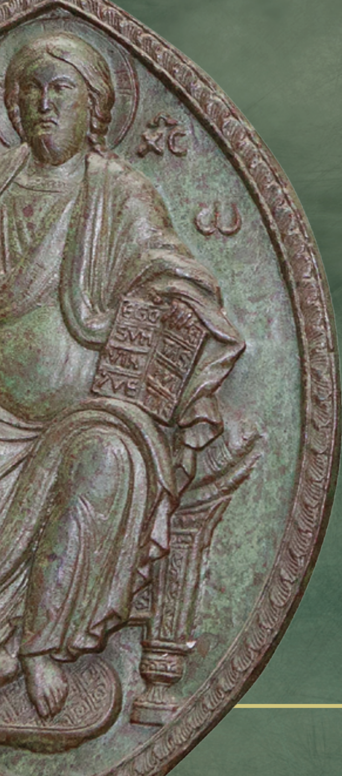
CRISTO PANTOCRATORE formella portale bronzo (part.) Barisano da Trani 1180-90 (?) Cattedrale di Trani