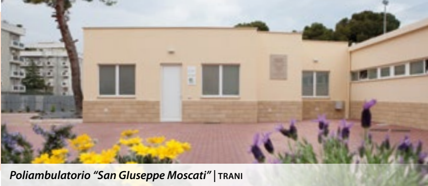
Poliambulatorio "San Giuseppe Moscati" | TRANI