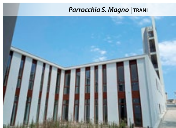
Parrocchia S. Magno | TRANI