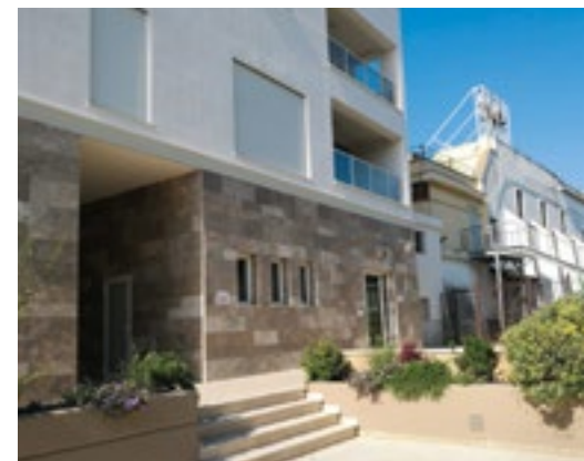
Casa canonica di S. Maria degli Angeli | BARLETTA

Per far fronte ai pagamenti relativi agli innumerevoli interventi in atto sopra indicati dei due fondi ottomille, su indicazione del Collegio dei Consultori e Consiglio AA.EE., si è dovuto ricorrere ad anticipazioni bancarie il cui costo è stato attinto dalla cassa diocesana, al fine di non erodere le somme dell'ottomille.