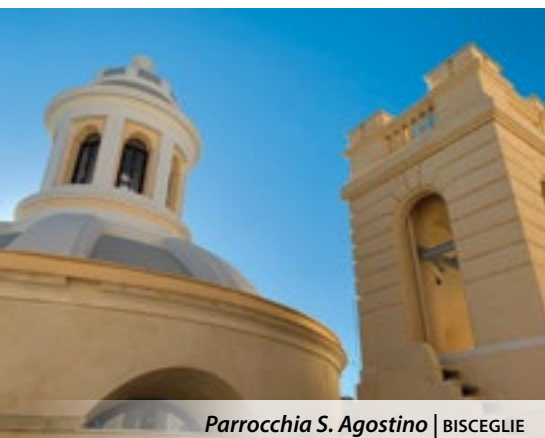
Parrocchia S. Agostino | BISCEGLIE

dei complessi parrocchiali esistenti. L'investimento nelle parrocchie e nelle sedi di altri Edifici di culto rimane una scelta prioritaria della pastorale diocesana. Contributi per € 350.000,00, sono stati prima assegnati, e poi erogati, a favore della nuova edilizia di culto di comunità parrocchiali per lo più di periferie, ed ancora prive del relativo complesso immobiliare (Parrocchie SS.ma Trinità in Barletta, San Pio in Margherita di Savoia, San Magno in Trani). Altra considerevole somma, pari ad € 212.000,00 è stata utilizzata per concorrere ai costi di interventi di straordinaria manutenzione o di restauro di altri edifici di culto esistenti o pertinenze degli stessi (chiese di Cristo lavoratore in Trinitapoli, S. Giuseppe in Corato, San Luigi ed Arcivescovado in Trani, San Silvestro in Bisceglie, Maria SS.ma dello Sterpeto e casa canonica di S. Maria degli Angeli in Barletta). Il restante 20% della somma a disposizione del fondo culto e pastorale è stata impiegata per finalità di formazione, di pastorale e di cultura: "Attività pastorali dei centri pastorali diocesani (intorno ad €24,000), ai tre Consultori d'ispirazione cristia-