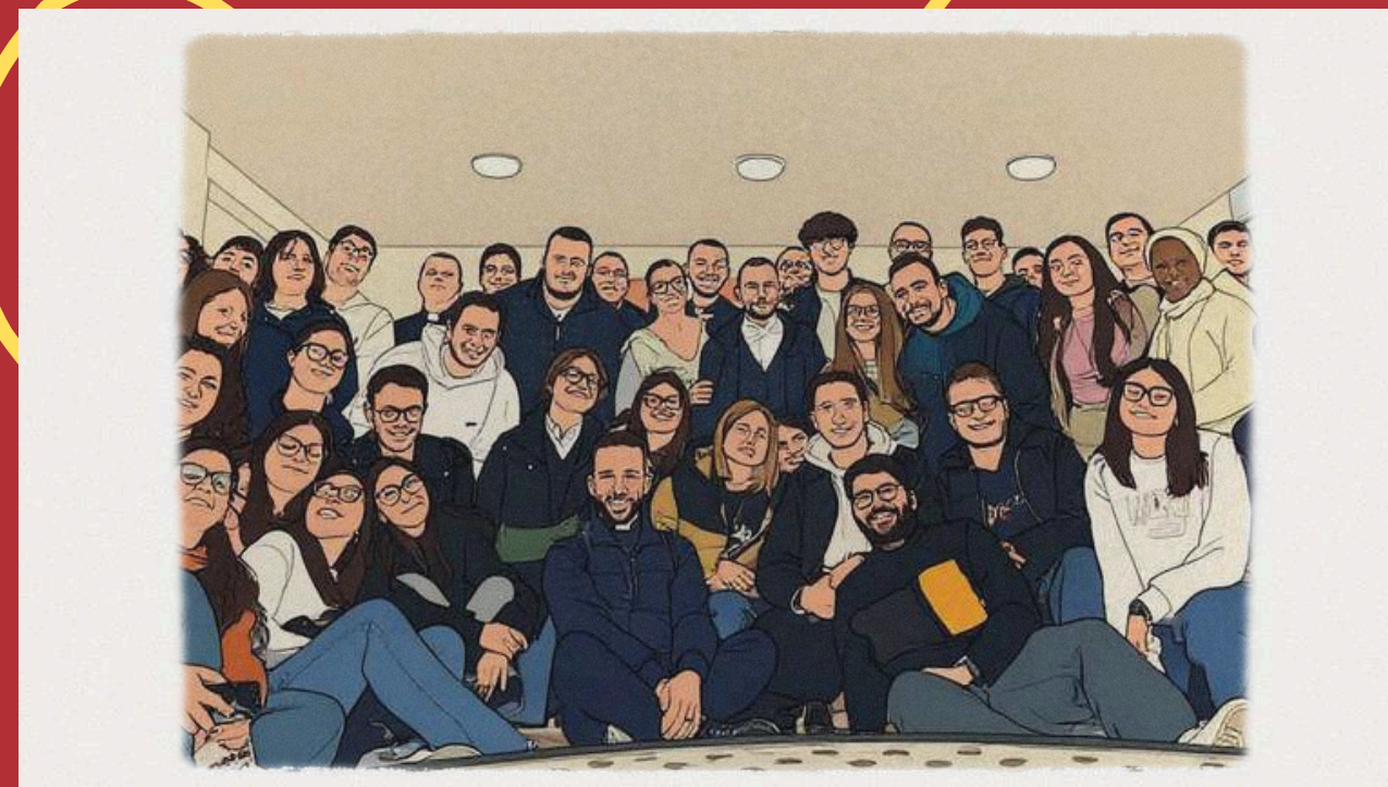
Chi te lo fa fare? Trani