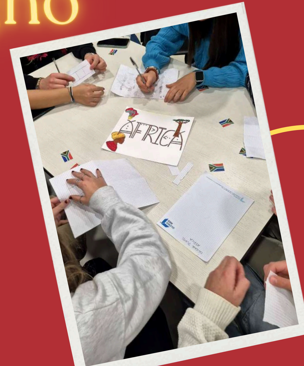
Chi vuol essere missionario? Bisceglie