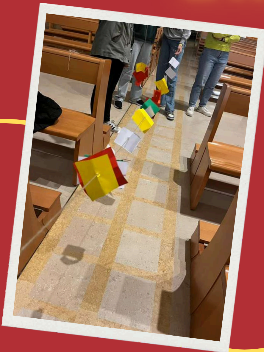
Mission is Possible Barletta